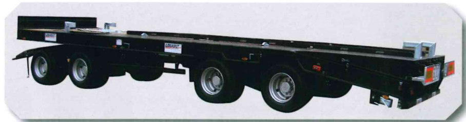
Remorque mixte porte engins / porte caissons