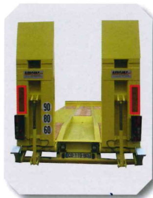
Fosse à équipement