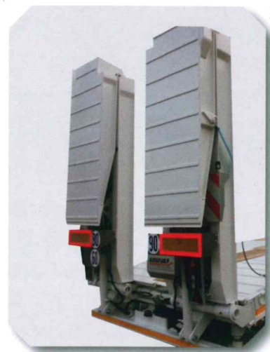
Rampes relevables et réglables en largeur hydrauliquement