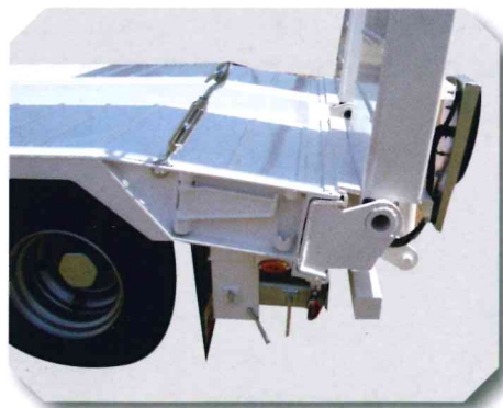
Pan coupé arrière