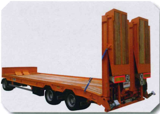
Plateau semi horizontal