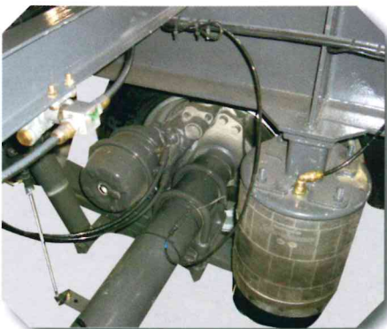
Suspension à air