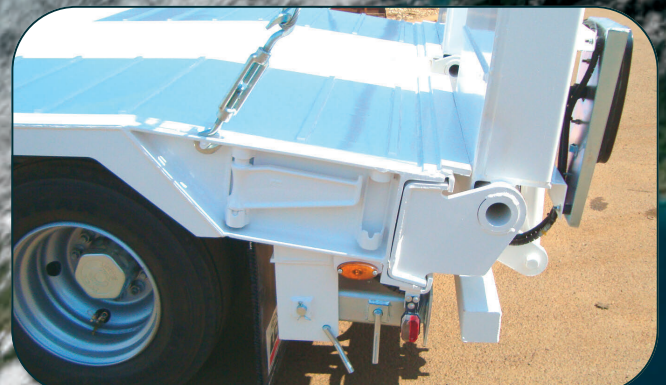
PAN COUPÉ ARRIÈRE