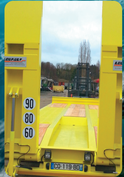
FOSSÉ À ÉQUIPEMENT