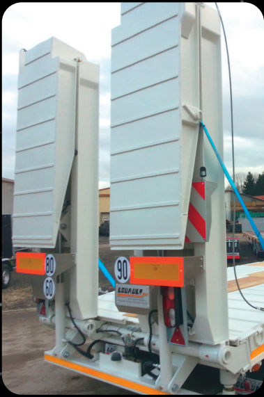
RAMPES RELEVABLES ET RÉGLABLES EN LARGEUR HYDRAULIQUEMENT