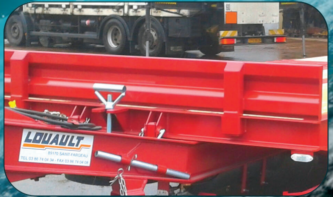
FACE AV AMOVIBLE