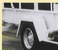
ROUES EXTERIEURES PLATEAU AILES METALLIQUES