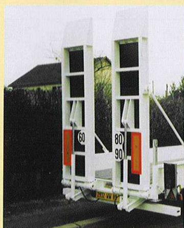
RAMPES AR HYDRAULIQUES