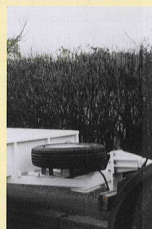
FLECHE ANNEAU FIXE ROUE DE SECOURS