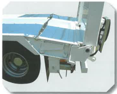
Pan coupé arrière