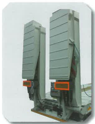
Rampes relevables et réglables en largeur hydrauliquement