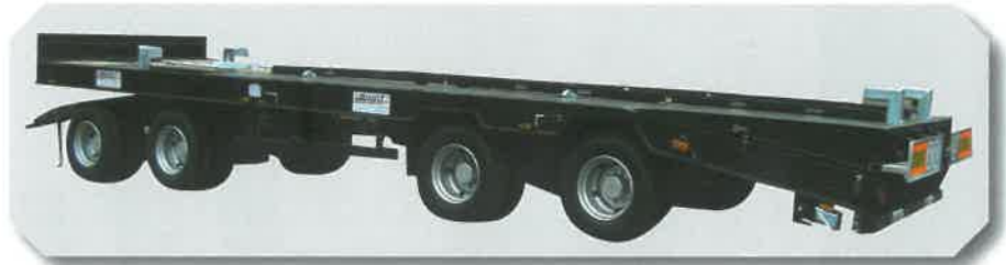
Remorque mixte porte engins / porte caissons