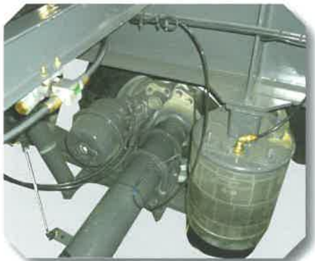
Suspension à air