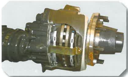
Freins à disques