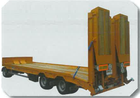
Plateau semi horizontal